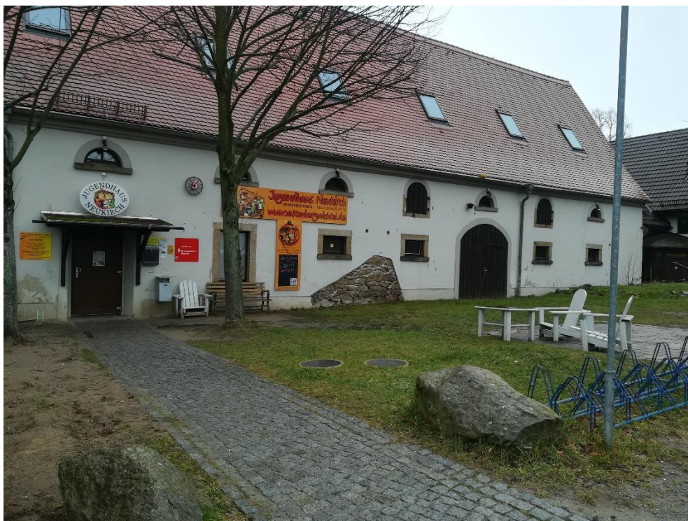
Siedziba Stowarzyszenia Valtenbergwichtel, w którym mieści się jednocześnie hostel, klub młodzieżowy - zarządzany przez młodzież.

Stowarzyszenie Valtenbergwichtel jest uznaną, niezależną, bezpartyjną organizacją, której statutowym celem jest praca na rzecz dzieci i młodzieży z siedzibą w Neukirch, w południowo-wschodniej części powiatu Bautzen (Budziszyn, wschodnia Saksonia). Od 1969 roku w Neukirch istnieje aktywny klub młodzieżowy - w rozumieniu grupy nieformalnej, z którego po 1990 roku rozwinęło się stowarzyszenie "Valtenbergwichtel".